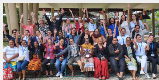
30 agents de santé - Nouvelle-Calédonie 2022

« Appréhender et déployer une démarche communautaire en prévention et promotion de la santé dans le cadre de la lutte contre les maladies non transmissibles »