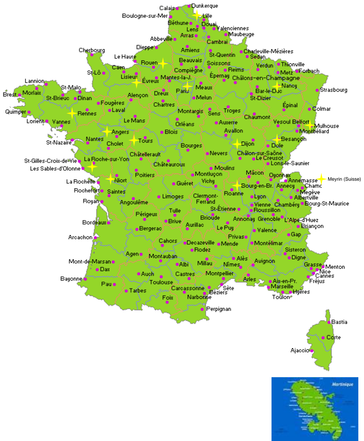
★ Lieux d'intervention de l'Institut Renaudot en 2011